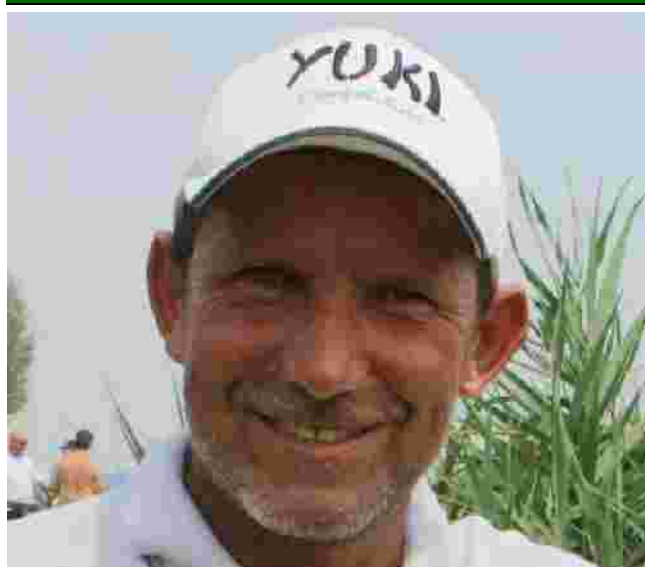
MAS SIMO VEZZALINI ASD NOI YUKI